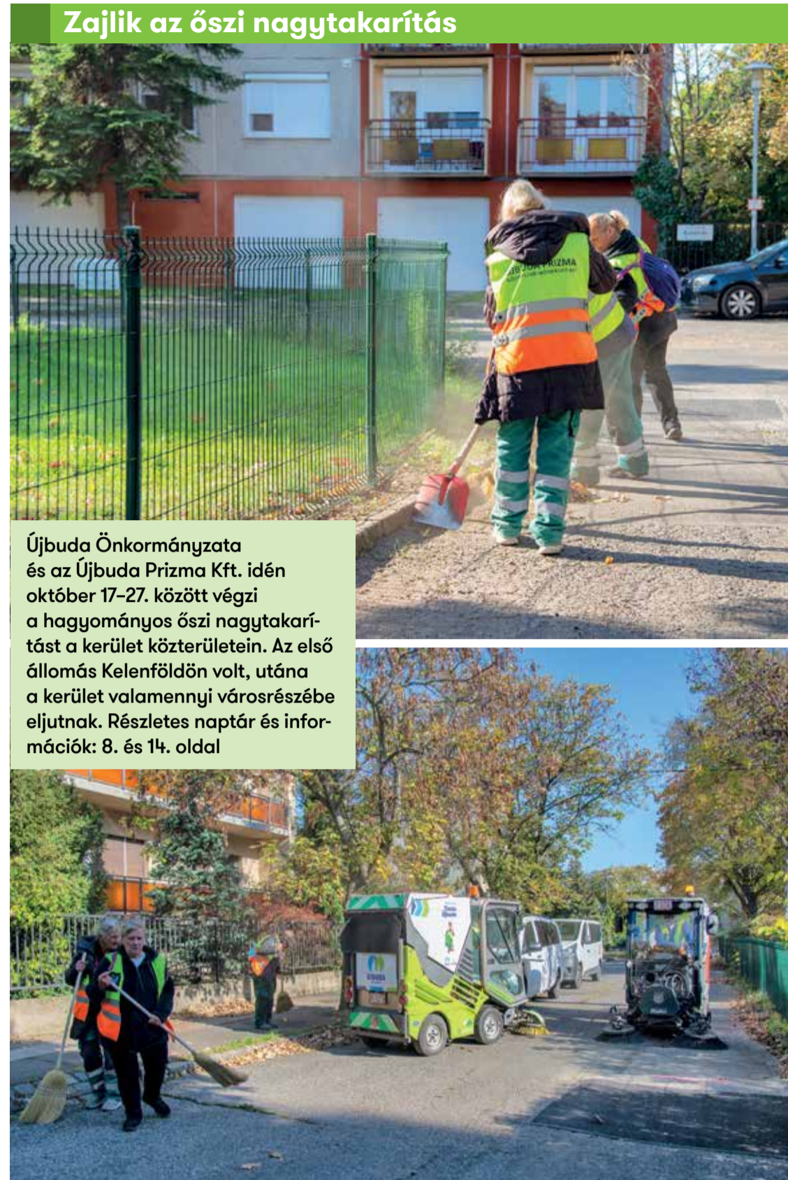
Zajlik az őszi nagytakarítás

Újbuda Önkormányzata és az Újbuda Prizma Kft. idén október 17–27. között végzi a hagyományos őszi nagytakarítást a kerület közterületein. Az első állomás Kelenföldön volt, utána a kerület valamennyi városrészébe eljutnak. Részletes naptár és információk: 8. és 14. oldal